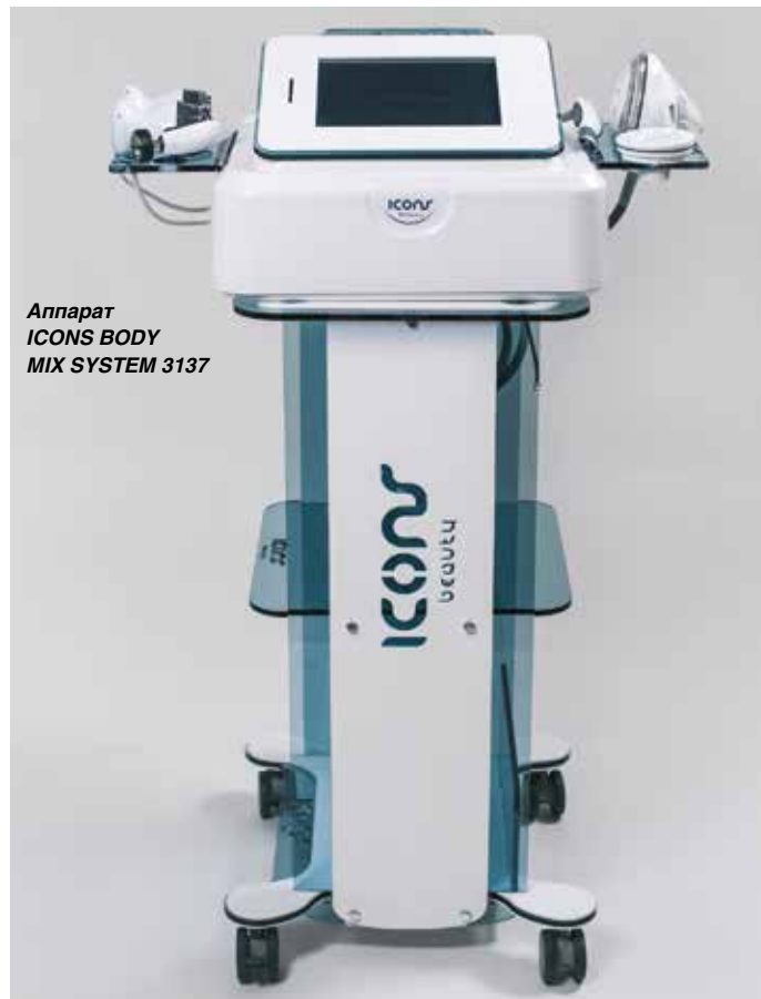
Аппарат ICONS BODY MIX SYSTEM 3137