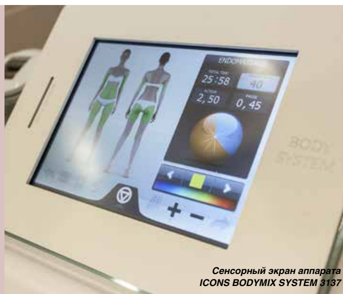
Сенсорный экран аппарата ICONS BODYMIX SYSTEM 3137

Благодаря этому можно выполнять целый комплекс процедур как по телу, так и по лицу: